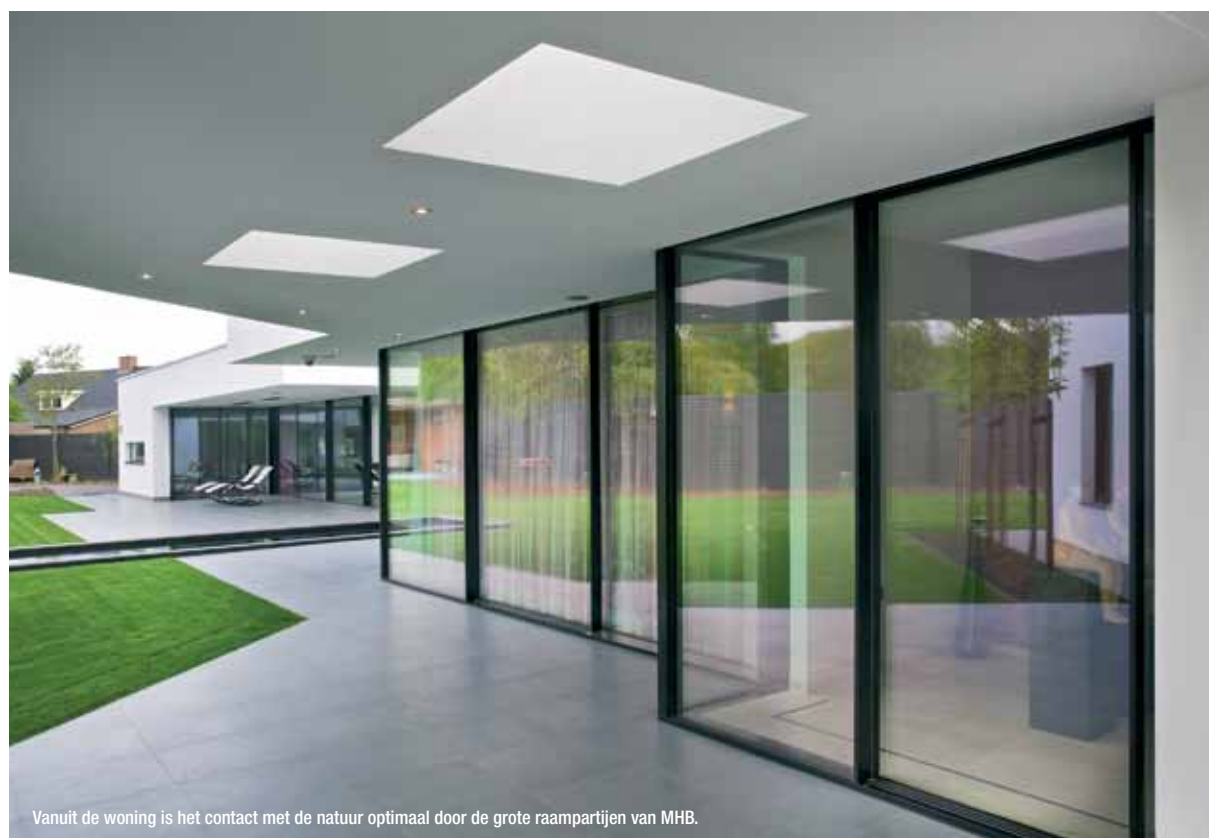
Vanuit de woning is het contact met de natuur optimaal door de grote raampartijen van MHB.

Bij binnenkomst in de ruime entree van de woning krijg je direct een gevoel van vrijheid en rust. De vele royale glaspartijen en de open structuur zorgen voor een prettige lichtinval. Door de hele woning is het contact met de natuur optimaal, mede doordat de ramen volledig van boven naar beneden zijn doorgetrokken, en door het gebruik van natuurlijke elementen. De link met de natuur was dan ook belangrijk, vertelt architect Arthur Wuts van Janssen Wuts Architecten. "We wilden bereiken dat je het gevoel hebt dat je buiten leeft, waardoor alle bouwelementen die nodig zijn om een woning te bouwen zijn weggewerkt. Zo zijn er binnen bijna geen binnenwanden, is er veel doorkijk en hebben we het dak optisch laten zweven. De overgang van binnen naar buiten is hierdoor heel klein. Door de