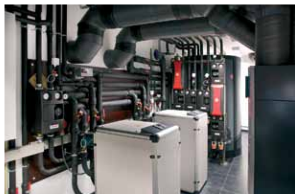
De duurzame energietechniek wordt aangestuurd vanuit deze grote technische ruimte en is ontwikkeld en geïnstalleerd door JTS Energietechniek.