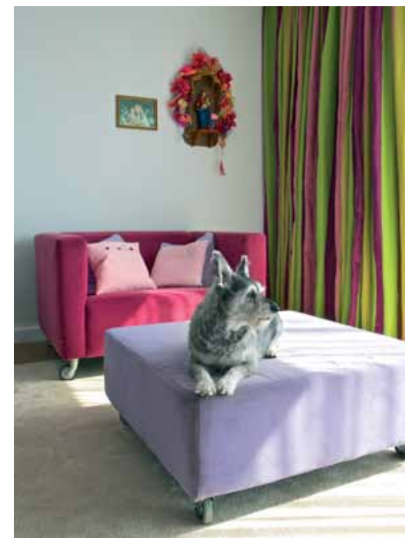
De perfect matchende zijden gordijnen van het merk Designers Guild alsmede de zonweringen en tapijten zijn geleverd door Beumers Ateliers - Interieurstoffering.

Niet alleen met de wensen van het echtpaar moest rekening worden gehouden. Ook met een ander belangrijk familielid, die ook wel wordt aangemerkt als de keizer in huis, oftewel: hond Basje. "Basje speelt een grote rol in het leven van het stel. Vanaf zijn domein in de woonkamer heeft Basje, door de extra lage raampartij, een mooi uitzicht op de straatzijde en kan hij alles goed overzien."