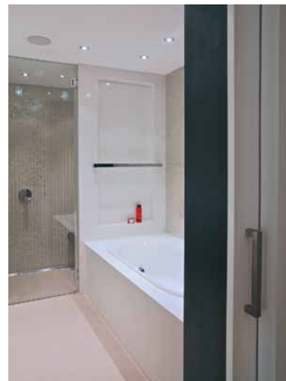
Installatiebedrijf Coolen & Luyten verzorgde de sfeervolle, praktische en luxueuze badkamer.