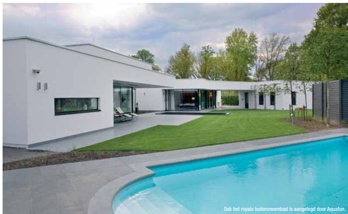
Ook het royale buitenzwembad is aangelegd door Aquafun.