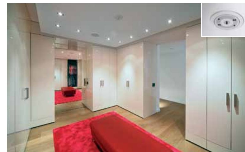
Tosj Houtmaatwerk heeft de handgemaakte garderobekasten vervaardigd. Novisec Security Systems heeft de inbraak- en rookdetectie verzorgd, onder andere door het toepassen van de rookmelder. Omdat deze uiterst vlak, in het plafond ingebouwd en onzichtbaar is, blijft het interieur onaangestast.