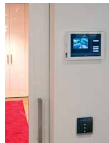
Het audio/video- en domoticasysteem is gerealiseerd door Herman van Kruchten.

"IN HET ONTWERP IS OOK REKENING GEHOUDEN MET DE KEIZER IN HUIS, OFTEWEL HOND BASJE"