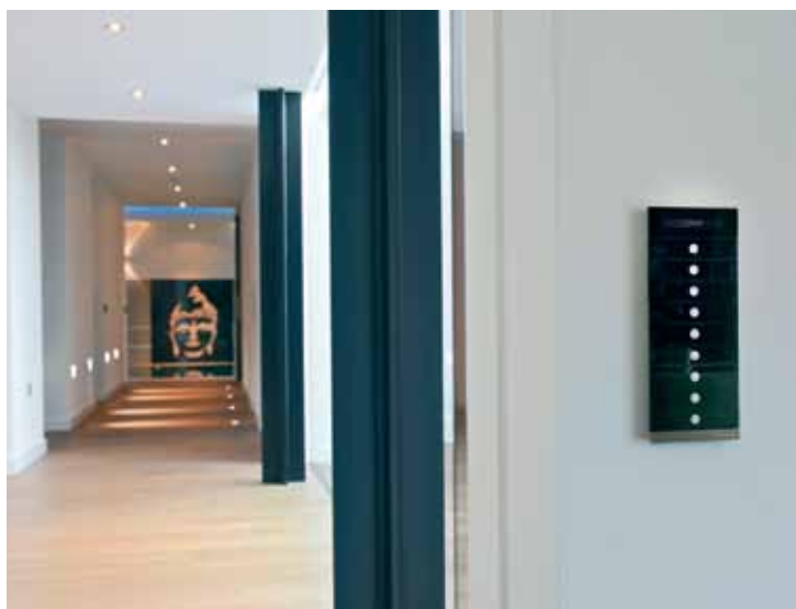
Electro van Montfort was verantwoordelijk voor de verlichting die wordt geschakeld door middel van de Busch-Jaeger PriOn.