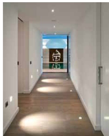
Verfpunt Echt heeft alle schrobvaste muurverven voor binnen geleverd. De muren van het zwembad zijn afgewerkt met een schimmelbestendige latex muurverf van Caparol.